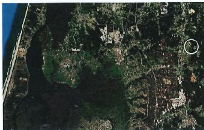
Fig. 2 - Situação do Monte de São Julião na plataforma costeira junto do sistema do Baixo Vouga Lagunar. Imagem GoogleMaps.

- A mamoas (Fig. 3), de c. 14m de diâmetro e construída em granito e quartzo, poderá recuar ao Neolítico/Bronze, sendo o primeiro testemunho da ocupação do local. O monumento apresenta a zona