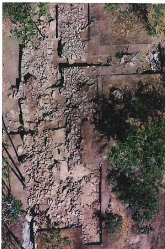
Fig. 4 - Muralha poente do povoamento, após os trabalhos de 2020. (Alfredo Leitão, Multimapa). Integrado na documentação da CMAV.

da câmara funerária danificada e alterada por reutilizações posteriores.