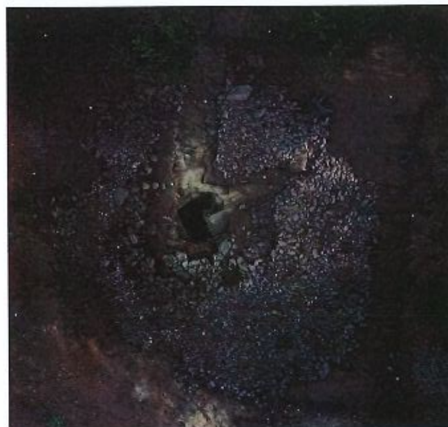
Fig. 3 - Mamoas de São Julião, após os trabalhos de 2024. (Alfredo Leitão, Multimapa). Integrado na documentação da CMAV.

- O conjunto está localizado no Monte de São Julião (Fig. 2), um cerro aplanado conhecido por Alto do Talêgre, expressão que remete para a existência de um marco assinalando o topo da elevação, mas que poderá ter designado o posto telegráfico. O cerro dispõe de grande domínio visual sobre uma vasta paisagem, incluindo, a poente, terrenos lagunares e o oceano Atlântico.