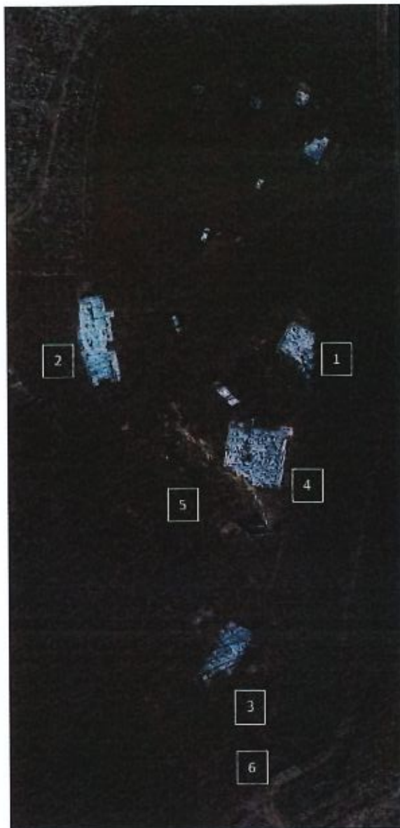
Fig. 1 - Detalhe de ortofotografia, vendo-se a propriedade municipal e os principais vestígios arqueológicos [1 - Telégrafo (séc. XIX); 2 - Muralha Poente e 3 - Muralha Sul (Finais da Idade do Bronze); 4 - Mamoas (Neolítico (?)/Idade do Bronze)] e geológicos [5 - Pedreira Poente; 6 - Pedreira Sul], Abril 2025. (Alfredo Leitão, Multimapa). Integrado na documentação da CMAV.

mamoas do Neolítico/Idade do Bronze, um povoado dos finais da Idade do Bronze e as ruínas de um posto telegráfico do século XIX (Fig. 1);