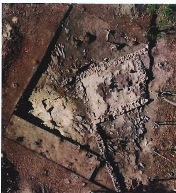
Fig. 5 - Telégrafo de São Julião, após os trabalhos de 2022. (Alfredo Leitão, Multimapa). Integrado na documentação da CMAV.

- A estrutura de delimitação do povoado (Fig. 4), uma expressiva muralha de terra e pedras de granito que rodeava o perímetro da elevação, datará de finais da Idade do Bronze. Encontra-se conservada, essencialmente, no rebordo poente da plataforma superior, e atualmente escavada numa extensão de várias dezenas de metros.