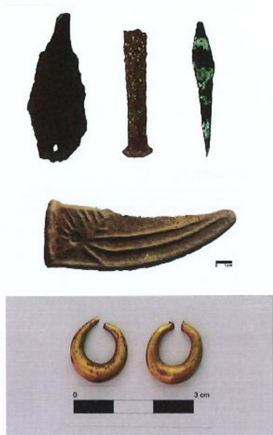
Fig. 6 - Objetos metálicos proto-históricos, em bronze, recolhidos em São Julião (lâmina de punhal(?); cabo de seta tipo Palmela e foice tipo Rocanes), e par de brincos proto-históricos, em ouro. Integrado na documentação da CMAV.

- O arqueossítio tem sido amplamente intervencionado pela CMAV, visando o seu conhecimento, conservação, valorização e disponibilização ao público.