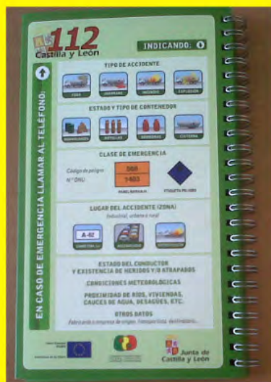
Guia de Boas Práticas