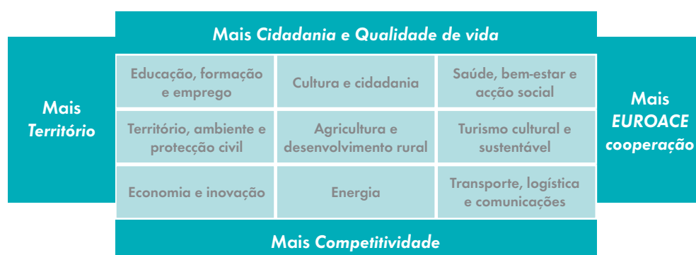
Matriz de Orientação Estratégica

A criação da Eurorregião EUROACE tem como fundamento inovar no modo de funcionamento da Comunidade de Trabalho, aperfeiçoando a sua organização interna e melhorando o desempenho das instituições que a integram, mas principalmente ganhando um novo posicionamento face ao exterior, que passa por dar maior visibilidade à EUROACE no contexto ibérico e europeu mas também passa por fomentar uma maior participação e implicação dos cidadãos na construção da Eurorregião.