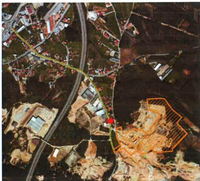
Figura 3 – Localização do recetor sensível (hexágono vermelho) relativamente à localização da pedreira, com indicação do trajeto de expedição.

Local de Amostragem: na envolvente da pedreira no recetor sensível identificado.