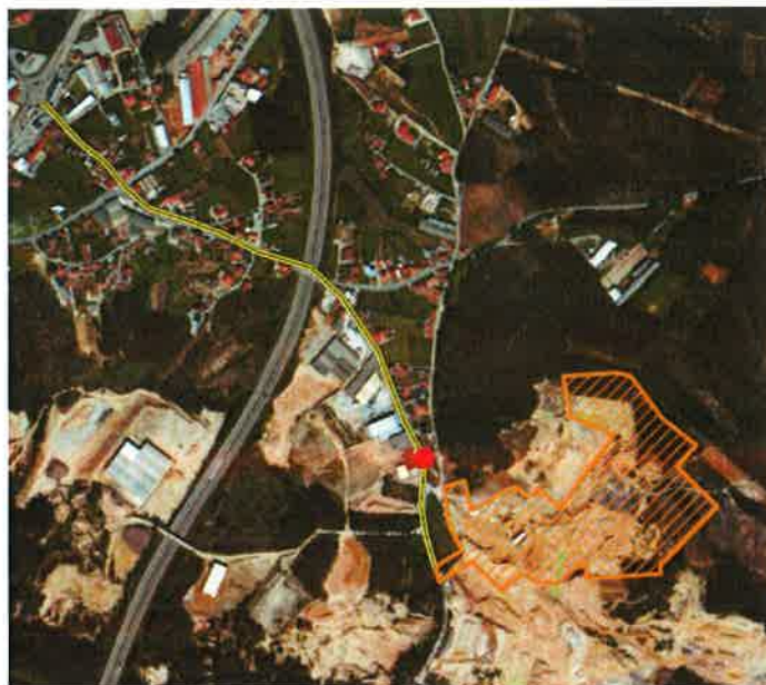
Figura 2 – Localização do recetor sensível (hexágono vermelho) relativamente à localização da pedreira com indicação do trajeto de expedição.

Locais de amostragem: no recetor sensível identificado.