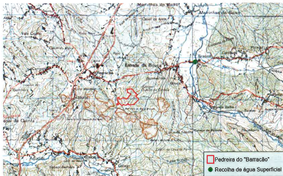
Figura 1 – Localização do ponto de recolha superficial previsto no EIA.

Locais de Amostragem: em dois locais do rio da Igreja Velha, um a montante (no local previsto no EIA) e outro a jusante do núcleo de exploração (após a confluência da linha de água existente a noroeste do núcleo de exploração e recetora das descargas oriundas da exploração com o rio da Igreja Velha – a cerca de 1350 m a jusante do ponto proposto no EIA) da pedreira do Barracão.