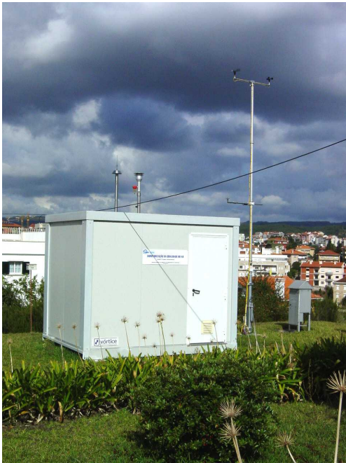
Estação da qualidade do ar do Inst. Geofísico

A avaliação da qualidade do ar é efectuada de acordo com os critérios legais estabelecidos, nomeadamente os critérios de localização de macro e micro escala das estações de monitorização, critérios relativos aos métodos de medição, critérios de qualidade de dados e registo dos resultados, entre outros.