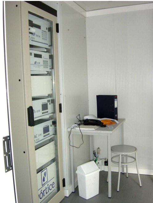
Interior de uma estação da qualidade do ar

A monitorização dos poluentes atmosféricos é efectuada em estações fixas, cujos analisadores da qualidade do ar funcionam em contínuo, medindo e armazenando os dados que são posteriormente enviados remotamente para uma base de dados da qualidade do ar que se encontra na sede da CCDR Centro.